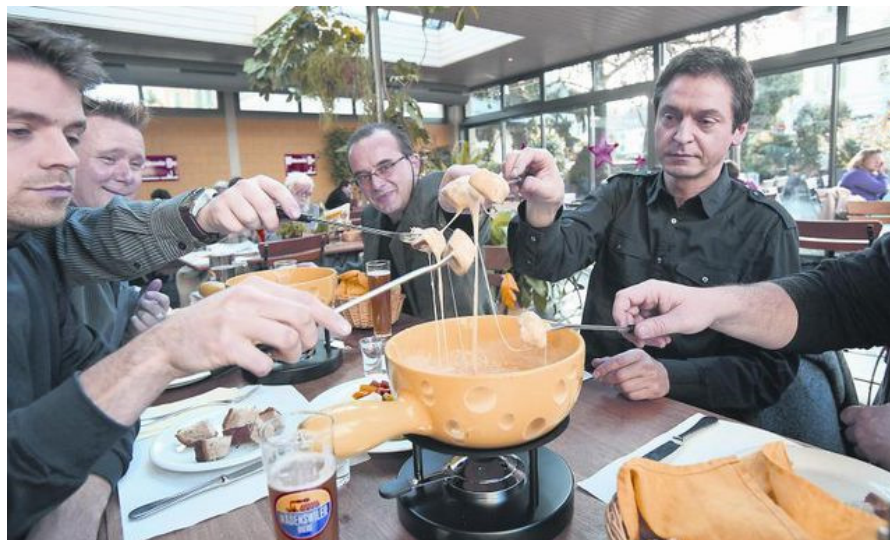
Bier und Bier gesellt sich gern: Der Autor, Schlegel, Weber, und Zbinden (v. l.) kosten das Bier-Fondue.

Im Wädi-Brau-Huus probieren wir das Fondue mit Bier und stellen fest: Es macht Schwatzer zu stillen Geniessern.